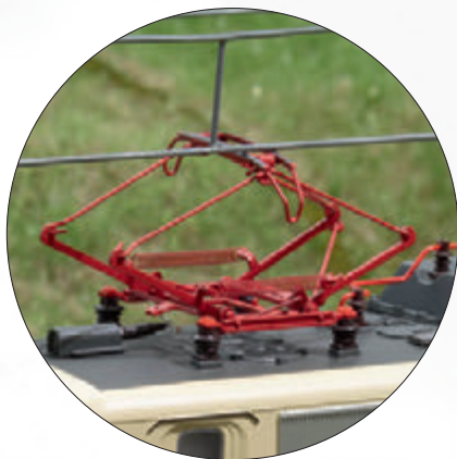
Neu konstruierte Stromabnehmer der Bauart DBS 54 digital heb- und senkbar

In ihrem Typenplan für Einheit-E-Loks definierte die junge Bundesbahn mit der Baureihe 140 eine Maschine für den Güterverkehr. Diese entsprach weitgehend der Baureihe 110, mit einer den Aufgaben angepassten Getriebeübersetzung. Sie kam aber auch vor Personenzügen zum Einsatz und war dank der enormen Stückzahl von 879 Exemplaren omnipräsent. Die Auslieferung begann im Januar 1957. Im August 1973 konnte die DB schließlich die letzte 140 in Empfang nehmen. Folglich gab es viele kleine Bauunterschiede. So erhielten einige Loks Verschleißpufferbohlen und eine Vielfachsteuerung für Doppeltraktion und Wendezugbetrieb. Bei privaten Bahnen sind sie bis heute im Einsatz. DB Cargo verzichtet seit Oktober 2016 auf ihre Dienste.