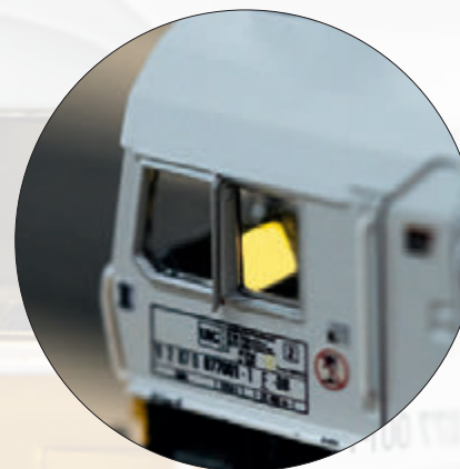
Die Beleuchtung des Steuerpults und des Führerstands sind digital schaltbar

Dieses Modell finden Sie im Märklin HO-Sortiment unter der Artikelnummer 39074.