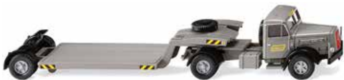
0502 06 Tiefladesattelzug (Henschel) Schweizer Transportspezialist 1955-61