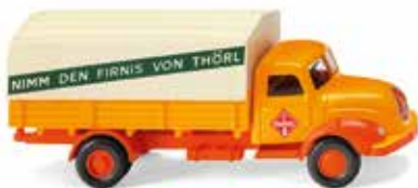
0420 03 Pritschen-Lkw (Magirus) Hamburger Ölmühlenprodukt 1958-67