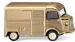
0262 08 Citroën HY Kastenwagen Die französische „Schweinenase“ 1947-81