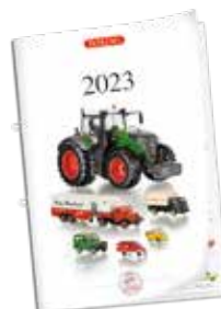
0008 01 WIKING-Katalog 2023 Der neue Katalog für WIKING-Freunde Katalog unterliegt Schutzgebühr