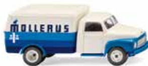
0354 03 Kastenwagen (Opel Blitz) Frische Wäsche fürs Revier 1952-60