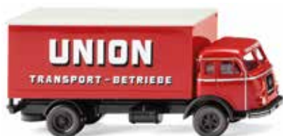
0425 02 Koffer-Lkw (Henschel) Kasseler Klassiker der legendären Spedition 1955-61