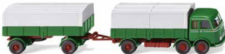
0429 05 Pritschenhängerzug (MB LP 333) Tausendfüßler im Fernverkehr 1958-61