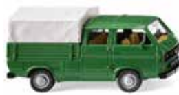
0293 09 VW T3 Doppelkabine Halbe-halbe für Mannschaft und Ladung 1979-92