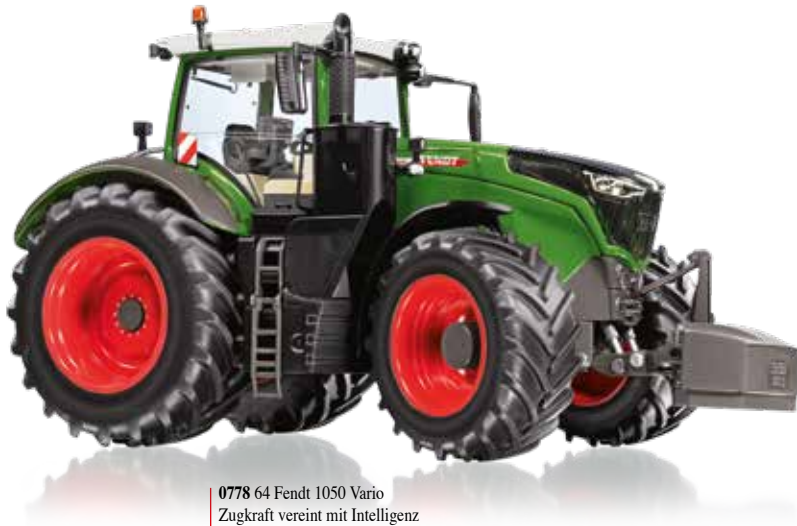
0778 64 Fendt 1050 Vario Zugkraft vereint mit Intelligenz